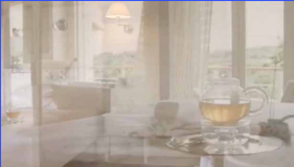
Stillbild från Der moderne Mensch wird in der Klinik geboren und stirbt in der Klinik: also soll er auch wie in einer Klinik wohnen! , Hedda Viå, 2013