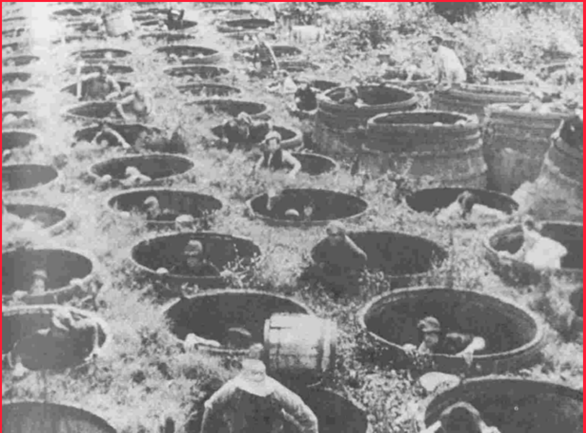
Stillbild från Strejken , Sergej Eisenstein, 1925